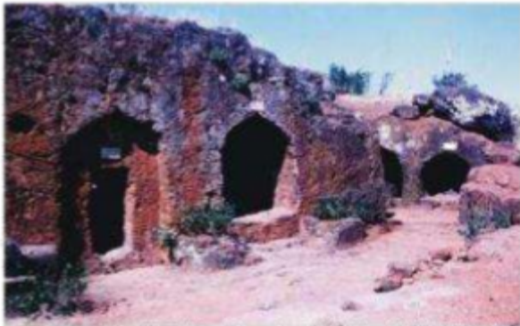
भुयारी शिवमंदिराचा पूर्वेकडील भाग