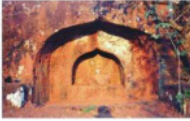
रापरर्षेसाठी शिवपिंडीसह असलेली प्राचीन गुहा