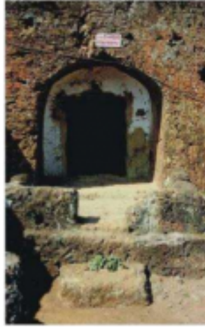
शिवमंदिराच्या पूर्वेकडील असाणारी बेटकीची गुहा